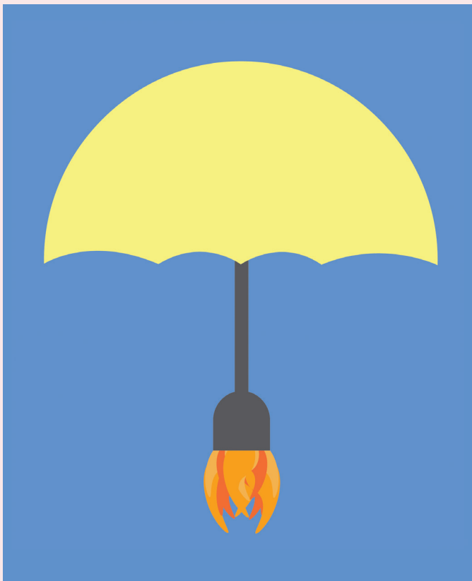
↑ Illustration von Olga Daucher , 2. Fachklasse Grafik, Schule für Gestaltung Bern und Biel

erleben konnte, nicht mehr so der Stubenhocker.» (Lernende Kauffrau, Login)