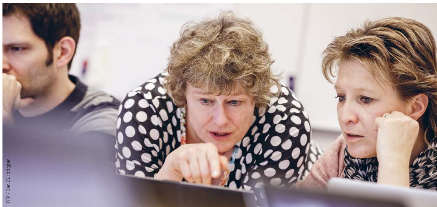
↑ Il est désormais plus facile d'intégrer les besoins individuels dans les études.

L'IFFP a révisé ses plans d'études et a introduit un nouveau concept de formation pour l'année académique 2019/2020. Grâce aux possibilités de formation en cours d'emploi et à la structure modulaire mise en place, les étudiantes et les étudiants sont de plus en plus en mesure de concevoir leurs cursus d'études de façon individualisée. La didactique par situation joue également un rôle important dans ce contexte, sans compter que les défis actuels, tels que la numérisation, ont été davantage pris en compte. Tout cela annonce une proximité avec la pratique des plus constructives.