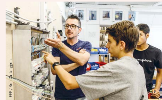
↑ Du point de vue pédagogique et didactique, le nouveau concept de formation est fortement influencé par la didactique par situation.

La structure et l'organisation curriculaires peuvent être illustrées par l'exemple de la filière d'études diplômante pour les enseignantes et les enseignants à titre principal des branches professionnelles (DBP), qui comprend 60 points ECTS. Afin de limiter la fragmentation typique des